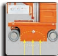
自动坑洞保护系统